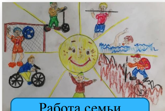
Работа семьи Корюковых