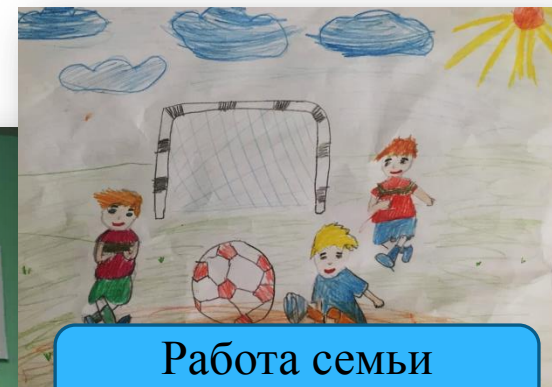
Работа семьи Аблудмановых