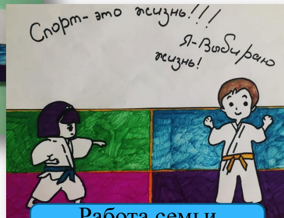
Работа семьи Козловых