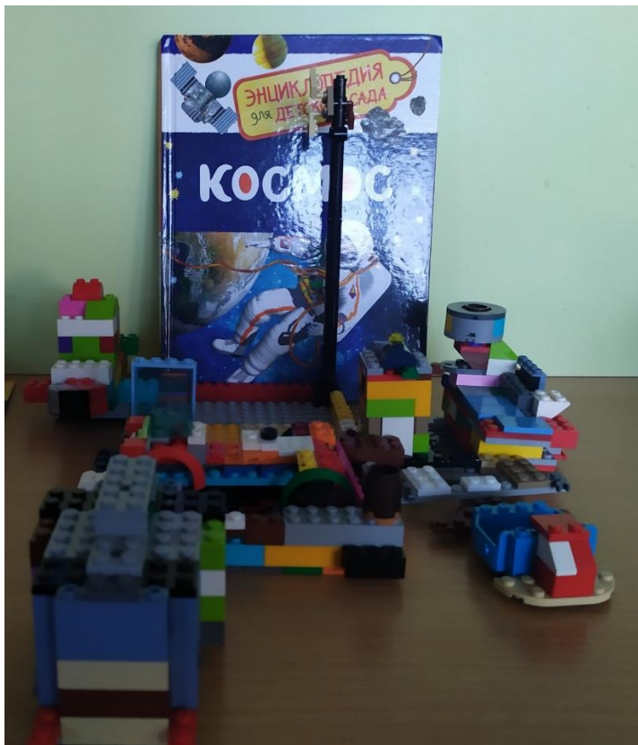
(семья Дерендяевых) «Космодром»