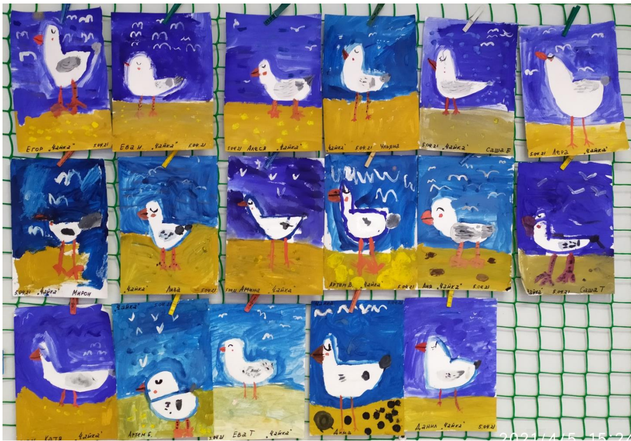
Рисование : « Птицы весной».