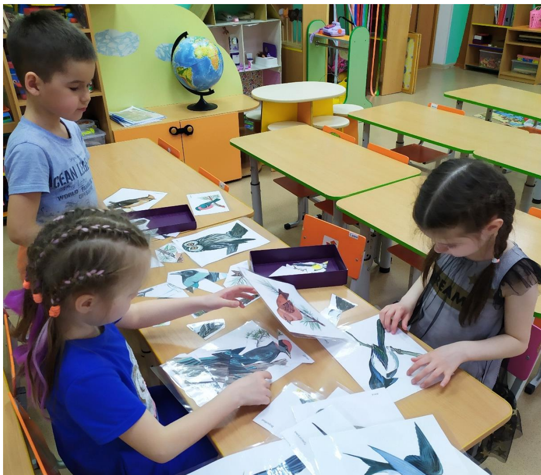
Игра «Собери птицу»