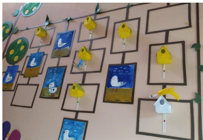
«Дом для птиц»